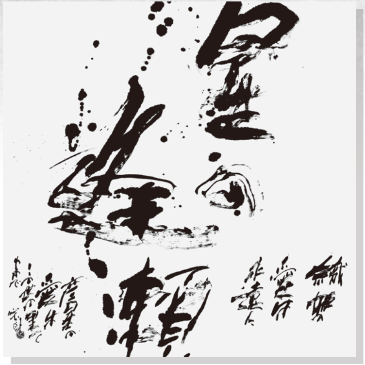
入船心太朗 (旭川市) 『星の逢瀬』 (121 × 121)