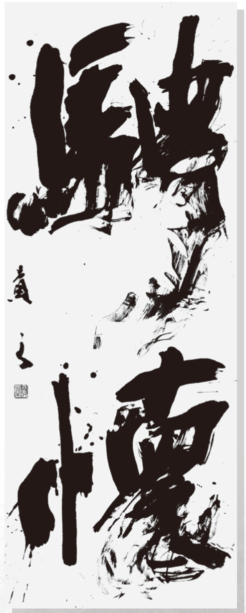
天満谷貴之 (函館市) 『騁懐』 (175 × 75)