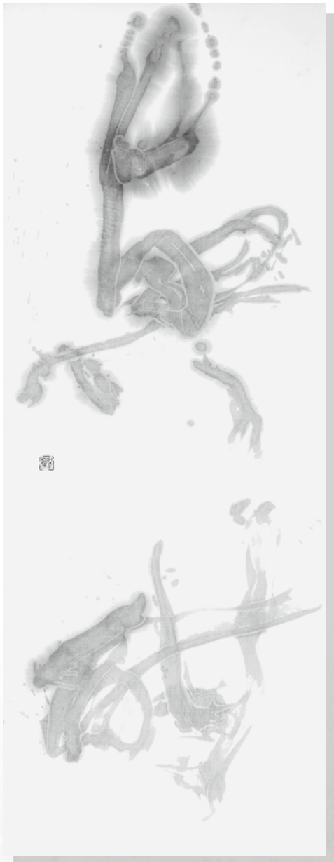
小林 聖鳳 (鹿追町) 『興酣』 (180 × 70)