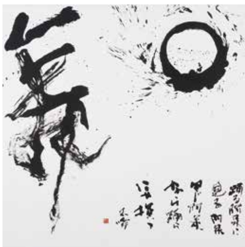
圓舞～踊る阿呆に見る阿呆 同じ阿呆なら踊らにゃ損々 150×150cm