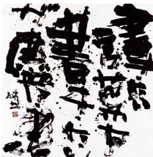
書きたい言葉を書きたいが儘に書く