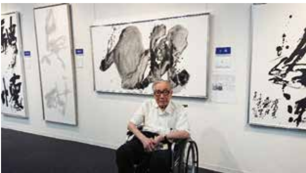
第1回大賞作品「塊」と。2021年8月3日、道新ぎゅらりー

北海道書道展、毎日書道展など道内外で作品を発表するなど今年（2023年）に100歳を迎える現在も、制作や後進への指導など精力的に書活動を行っている。