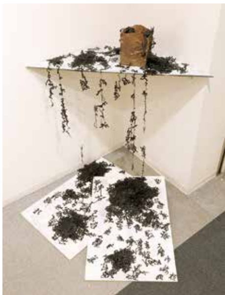
天地玄黄、宇宙洪荒…… 70×70×h100cm